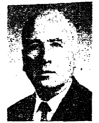
الامين . وقد اصبح هذا الامر معروفا جيدا

نص هذا العنوان كبت صحيفة «الجمهورية» نقول : ان جولة الرئيس الفرنسي ، وسياسات دستان ، في بلدان الشرق العربي نبعثت منها رائحة مزدوجة : رائحة القنطاريون الذي نهم فرنسا بتجهيزها بصورة منتظمة ، ورائحة البارود الذي يكمن في الاسلحة المتطورة التي يورد الرئيس تجهيز هذه البلدان بها .